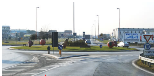
Rotonda 8 Marzo